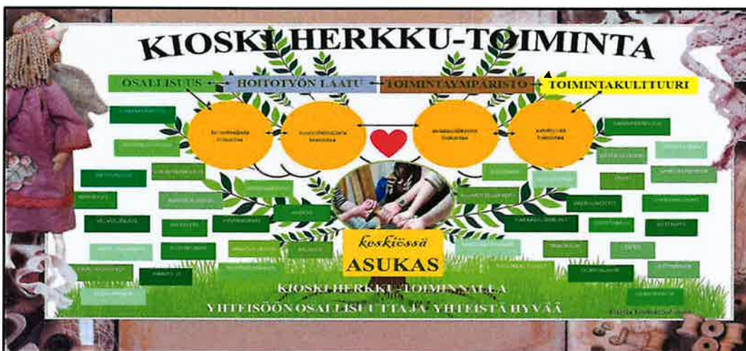
Kuvio 1. Kioski Herkku -toiminta tarjoaa asukkaalle toiminnallisuutta ja osallisuutta

Osallisuutta ja toiminnallisuutta Yhteisökodissa tuetaan mm. Kioski Herkku -toiminnalla. Kioski Herkku -toiminta on eräänlainen ohjauskeino, jolla tuetaan asukkaan sosiaalista toimintakykyä ja osallisuutta yhteisössä. Konkreettisesti Kioski Herkku -toiminta on, kioski toimintaa, myyjäistoimintaa, jota toteutetaan Yhteisökodissa asukkaiden ja hoitajien kanssa yhdessä.